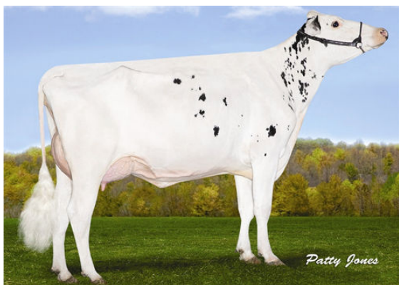
VELTHUIS SG SNOW EVENT FIFTH DAM